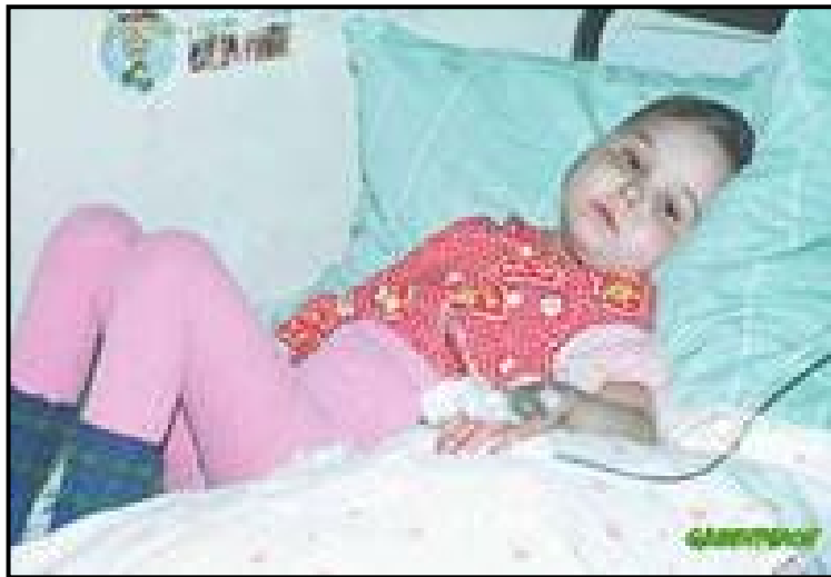
مندالانى نەخۆش لە بەخشی نەخۆشەكانى خوينى نەخۆشخانەى ژومارە ١٤ مندالانى كيڤ لە كۆمارى ئۇكرائىن

نەخۆشى مندالانى ساوا پيوەندى راستەوخۆى دەگەل نەخۆشى ژنانى ئاوس و كاتى زايىن ھەيە. بە دواى سالى ١٩٨٦دا نەخۆشىي جۆراوجۆرەكانى مندالانى شارى مينسك ٣. ٦ لە سەدى ولە ئەيالەتى ماگليوف ٥,٥ لەسەد چۆتە سەر. "موتاسيۆنى" خۆزايى كرومۆزۆمەكان ١,٥ تا ٢ جار زۆرتر و رادەى ئالۆزىەكانى تەواوكارى زگماكى لە ١٧ ناوچەى ئەيالەتەكانى گۆمل و ماگليوف لە ٤,٠٨ (لە سالە كانى ١٩٨٥ - ١٩٨٣) بوو و پاشان گەيشتۆتە ٧,٦٨ لە سەد.